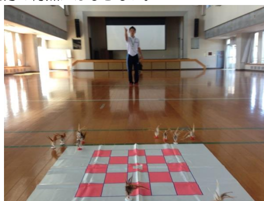
赤・白交互にアンダーハンドで投げる