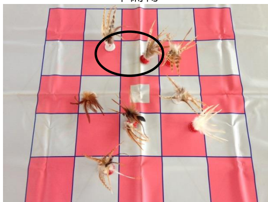
相手のマスに入っても得点にならない