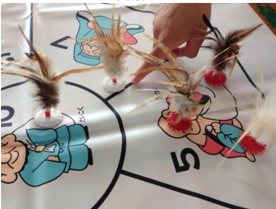
線にかかったり、倒れたりした羽根は無得点