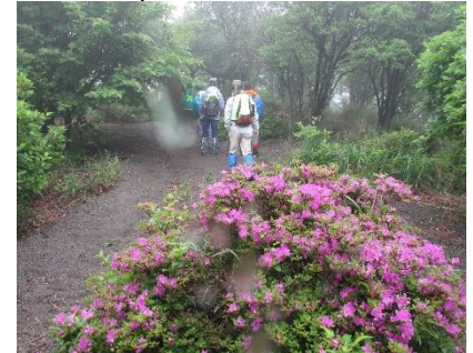
つつじコース入口付近