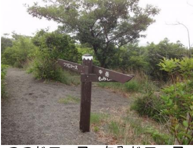
つつじコース、もみじコース 分岐点