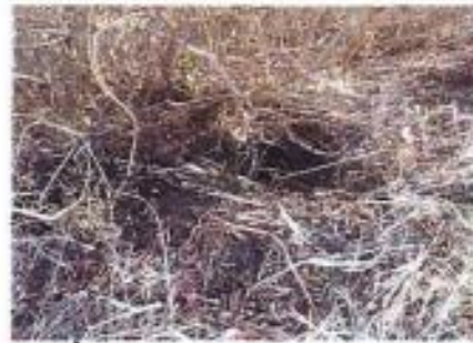
イノシシの掘った跡