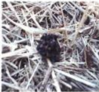
テン・イタチの痕跡（糞）