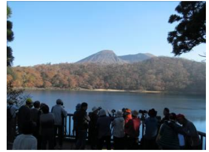
六観音御池展望台