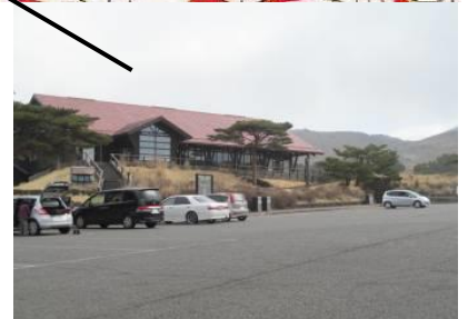
えびのエコミュージアムセンター