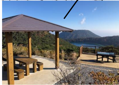
二湖パノラマ展望台