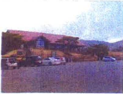
エコミュージアムセンター