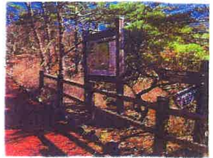
つつじヶ丘散策路付近