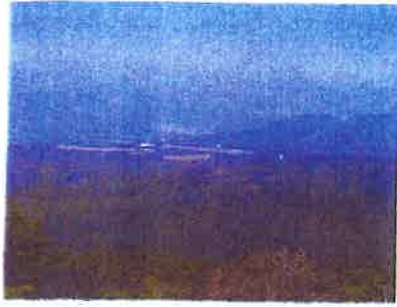
栗野岳方面を望む