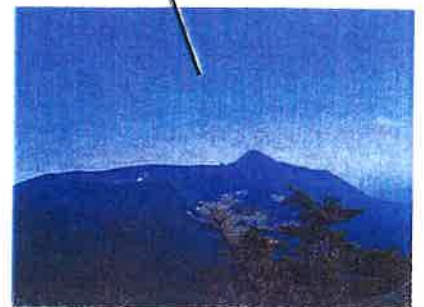
大浪池山頂付近から新燃岳を望む