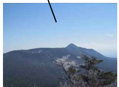
大浪池山頂付近から新燃岳を望む