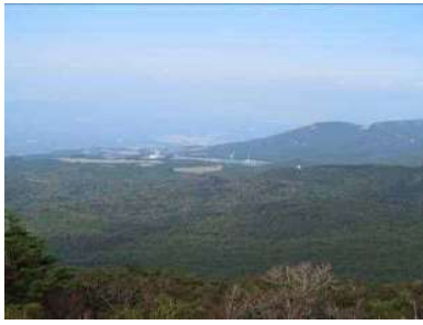
栗野岳方面を望む